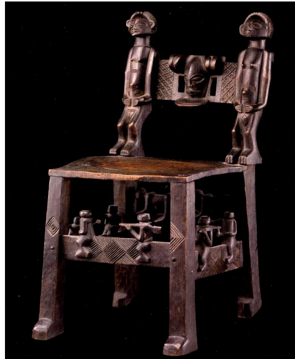
Koningszetel, naar Europees model

typische, gevleugelde hoofdtooi en werd voorgesteld met het imago van een voorouder die vrede en welvaart brengt en de rust van het hiernamaals symboliseert. Hij wordt ook afgebeeld terwijl hij in zijn handen klapt: een geste waarmee hij zijn volk voorspoed toewenst. De koning werd ook afgebeeld als jager, muzikant, of pijproker. Bij zijn kroning krijgt de nieuwe vorst de waardigheidssteken die bij het ambt behoren en die zijn macht bevestigen. Hij krijgt de speciale armband ( lukano ), die bedekt is met rood en blauw textiel en soms met kaurischelpen. Hij ontvangt ook het tweesnijdende zwaard ( mukwale ), dat vroeger ook het beul's zwaard was en de koningsscepter. Hij draagt dan de speciale hoofdtooi ( cipenya mutwe ) met de beide vleugels naar achteren gebogen. Deze hoofdtooi is bekend van de beelden van Chibindi Ilunga. De nieuwe vorst ontvangt dan ook de koningszetel: met boven in de rugleuning het hoofd van de vorst (of stelt het opnieuw Chibindi Ilunga voor?) en met fraai gebeeldhouwde scènes uit het leven op de verbindingsstijlen tussen de poten van de zetel.