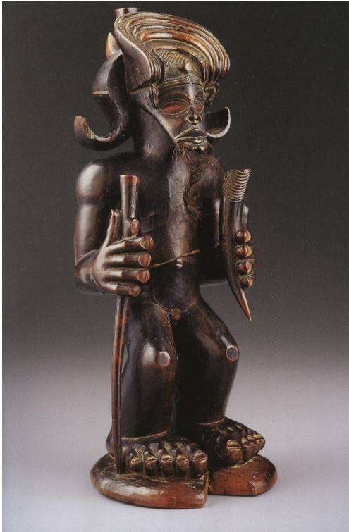
Beeld van Chibinda Ilunga Tshokwe

De legendarische jager en held Chibinda Ilunga is zo almachtig en alomtegenwoordig in de mythologie, dat volgens sommige onderzoekers veel afbeeldingen van koningen gemaakt zijn in de klassieke stijl om op hem te lijken. Deze beelden behoren tot de meest indrukwekkende voortbrengselen van de Afrikaanse kunst: de kracht en macht van de jager en de mythische held worden getoond in zijn knoestige handen en voeten, zijn nek en schouders. Toch zijn delen ook uiterst verfijnd weergegeven, zoals de nagels van vingers en tenen, de vingerkootjes, en zijn gelaatstrekken. In veel beelden is echt haar gebruikt voor de baard.