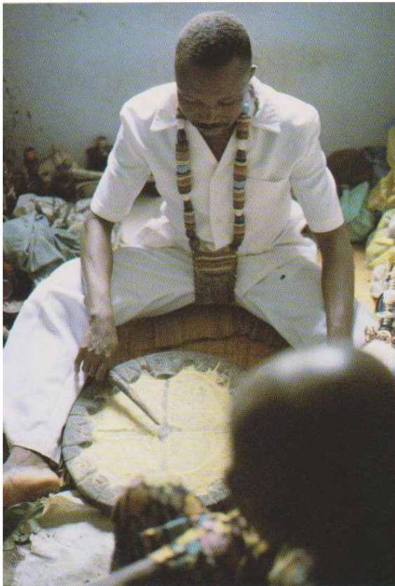
Babalawo raadpleegt Ifa orakel

Bij ziekte en tegenslag, bij twijfel of angst om de juiste beslissing te nemen, neemt de Yoruba zijn toevlucht tot Ifa . Deze brengt vrede, herstelt het zelfvertrouwen van mensen.