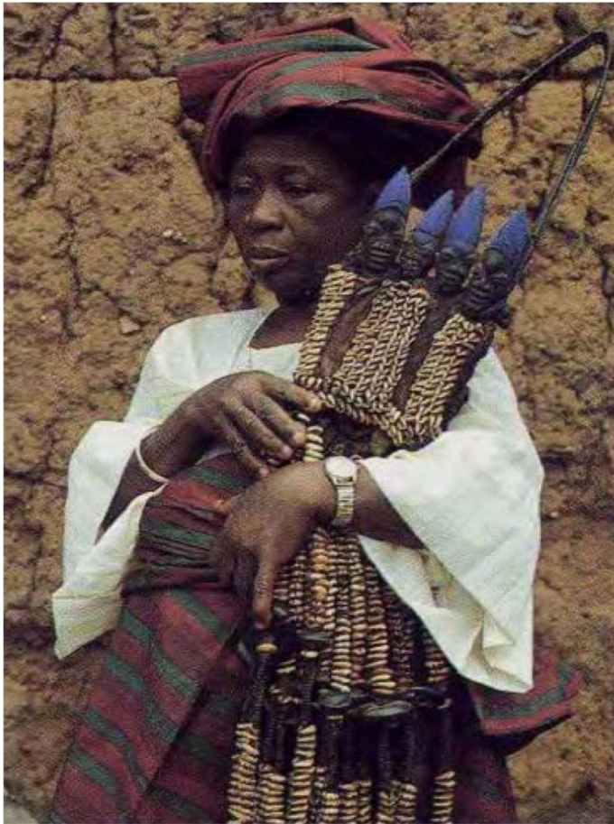
Vrouw draagt de figuren van de Orisa Eshu Yuroba Nigeria

Van alle Orisa bij de Yoruba heeft niemand meer artefacten dan Ifa . In alle belangrijke verzamelingen in de wereld vinden we attributen van het Ifa orakel, zoals het orakelbord ( opon ifa ), de ivoren (soms houten) tapper ( iroke ) waarmee de babalawo op het bord tikt om de kracht van Ifa op te roepen, de houten schalen ( agere Ifa ) waarin de heilige palmnoten worden bewaard, en de met kralen bezette tassen. Onder druk van kerstening en islamisering van het gebied zijn veel van de (oude) voorwerpen verkocht (in sommige gevallen: gestolen) en staan nu in openbare en particuliere verzamelingen in Europa en Amerika.