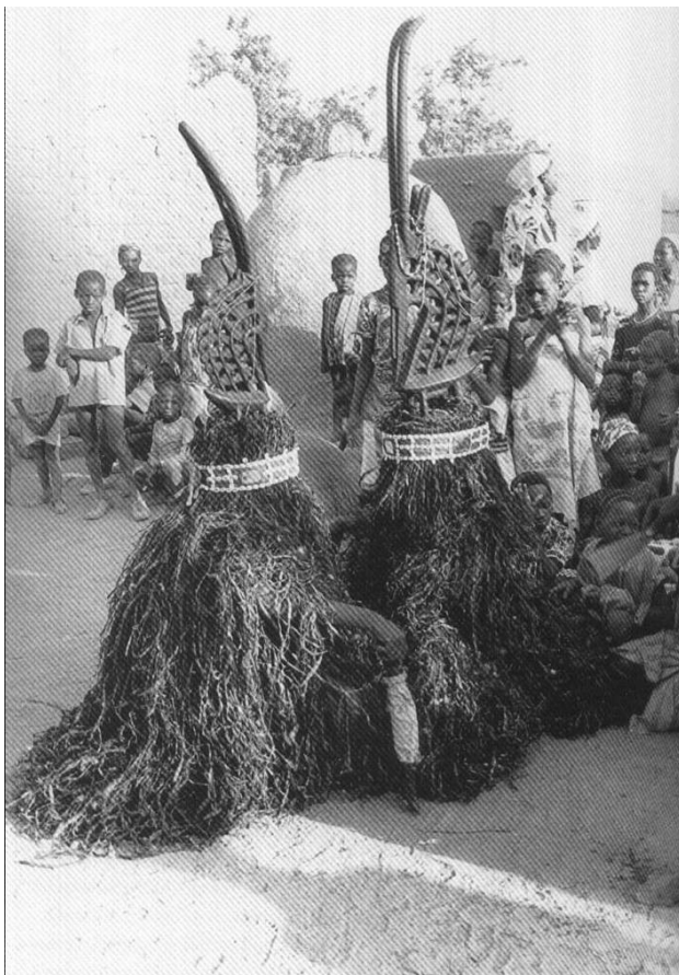
Mannelijk en vrouwelijk Ciwara masker dansen Bamana, Mali

contacten heeft. In de praktijk betekent dit dat voor iedere Bamana, man en vrouw, het lidmaatschap van minstens een zogenaamd genootschap cruciaal is voor het vermeederen van levenskracht. Deze genootschappen worden beschouwd als de beschermers van waarden en normen in de samenleving, en als intermediairs tussen deze wereld en die van de spirituele krachten. Mensen verenigen zich in genootschappen volgens het beroep dat zij uitoefenen. Landbouwers, smeden, orakelkundigen, pottenbakkers, medicijnmannen, zij allen zijn lid van hun eigen genootschap. Ieder genootschap heeft zijn eigen bijeenkomsten, eigen feesten en rituelen. Vooral de maskerfeesten trekken veel aandacht, zoals de ciwara dansen (met hun antiloopt maskers) van de landbouwers, de warakun dansen (met kracht maskers, bedekt met korsten van bloed) van de smeden, en tientallen anderen.