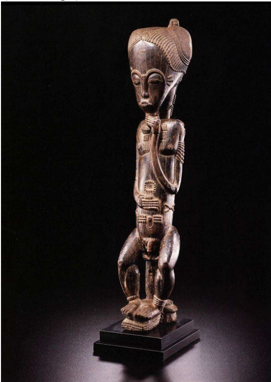
Blolo bian Baule Ivoorkust