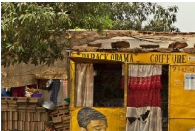
Traditionele kapperszaak langs de weg in West Afrika

In de moderne urbane samenleving is het kappen tot een vak geworden. Uithangborden aan de voordeur tonen welke kapsels binnen kunnen worden gemaakt. Wie de kappersborden bestudeert die in de afgelopen veertig jaar zijn gemaakt in de grote steden van Afrika, ziet welke 'haarstijlen' achtereenvolgens populair zijn geweest en welke prominente persoonlijkheden op het wereldtoneel in een bepaalde periode actief waren. Daaronder: President Kennedy, President Clinton, Martin Luther King, James Brown en uiteraard de eigen politieke leiders. Maar kapsels werden ook vernoemd naar de opening van een nieuwe brug, de landing op de maan, een recente staatsgreep en het nationale voetbal elftal.