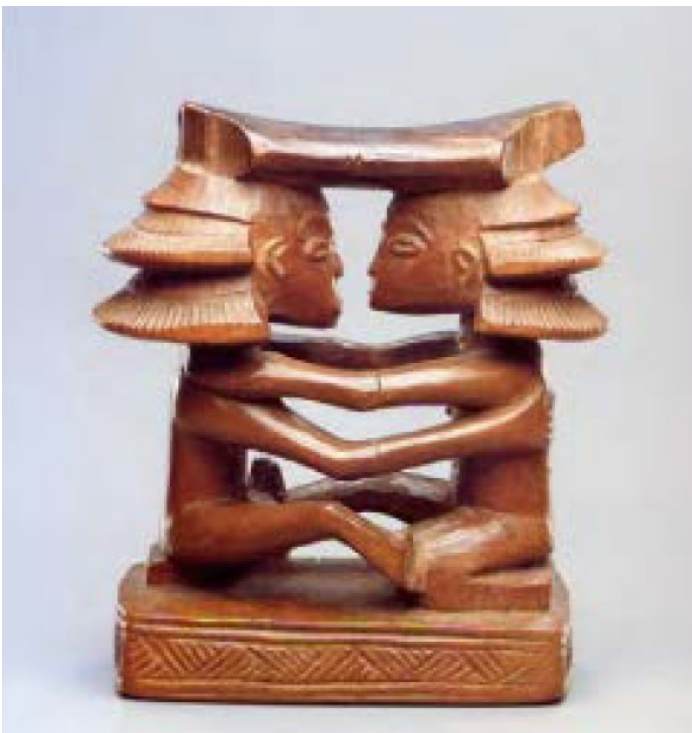
Luba hoofdsteun uit Congo. Laat populaire vrouwen haarstijl zien in de figuren rond 1920

Haardrachten vertellen in veel geval iets over de status van het individu: weduwen dragen andere kapsels dan ongehuwde meisjes. Maasai krijgers bevestigen leeuwenmanen aan hun kapsels om hun imago van onoverwinnelijkheid te illustreren. Maasai meisjes daarentegen versieren hun kapsels met uiterst vrouwelijke hebbedingetjes, zoals kraaltjes, muntjes, spiegeltjes en bewegende aluminium plaatjes.