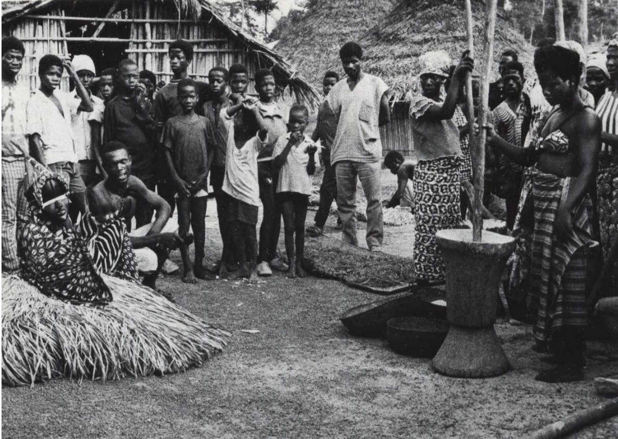
Masker bij de Dan vragen huisvrouwen om voedsel voor de initiandi

Bij de Dan van Ivoorkust verblijven de initiandi ongeveer zeven weken in het besnijdeniskamp. Een belangrijke rol in de organisatie van het kamp is gereserveerd voor het masker De-angle , ook wel Mandorple genoemd. Dit masker trekt samen met het masker Ble laat in de middag, als de vrouwen in het dorp bezig zijn met de bereiding van de avondmaaltijd, vanuit het kamp naar het dorp om voedsel te verzamelen voor de initiandi. Deze maskers dansen of zingen niet en worden niet begeleid door muzikanten. Zij gaan de binnenplaatsen op waar de vrouwen staan te koken en vragen met humor en plagerijen om voedsel, dat door de vrouwen graag gegeven wordt, omdat zij weten dat het voor hun kinderen is. De antropoloog Hans Himmelheber heeft zeven weken lang iedere dag een dergelijk kamp bezocht en er een dagboek van bijgehouden. (Himmelheber. 1979)