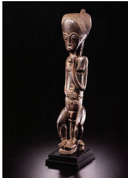
Blolo bian Baule Ivoorkust

Daarvoor zal een afbeelding gemaakt worden van de partner. Een vrouw zal aan een beeldsnijder vragen om een ideaal beeld te maken van haar blolo bian . De man kan worden uitgebeeld als een wijze man gezeten op de zetel van een man van gezag. Omgekeerd zal de man een ideaal-beeld laten maken van zijn blolo bla . De vrouw zal een schoonheid zijn. Maar er zijn ook afbeeldingen bekend van blolo bla als verpleegkundige, of als moderne vrouw in modieuze kleding en op hoge hakken.