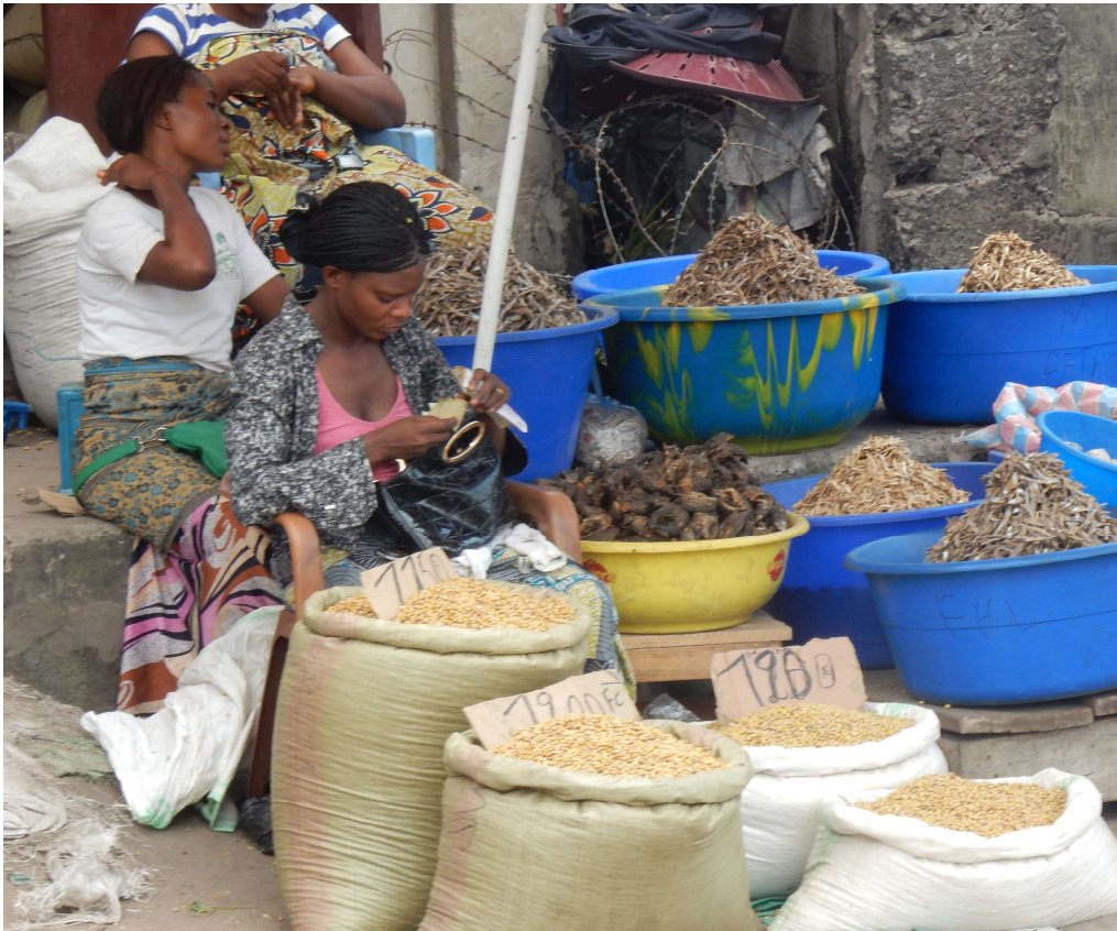
Vrouwen verkopen graan en vis op de markt in Kinshasa, 2017

Ook in de havenstad Takoradi hebben vissersvrouwen zich georganiseerd in groepen van vier of zes vrouwen. Een groep kan een visnet kopen, dat zij verkopen aan de vissers van een boot. Deze mannen op hun beurt verkopen hun vangsten aan de crediteuren en betalen al doende het net af.