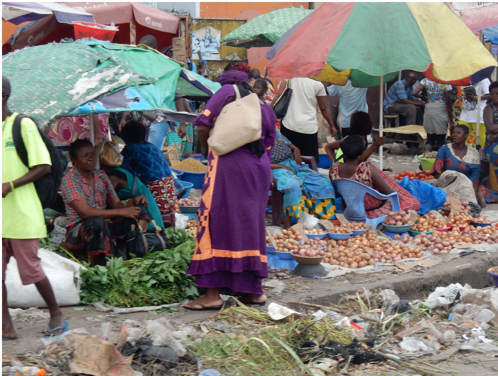
Vrouwen verkopen op de markt groenten uien Kinshasa Congo