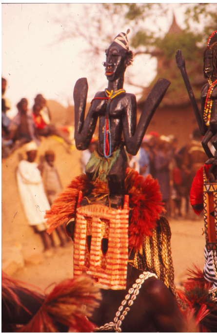
Satimbe masker Dogon, Mali

Jongens leren het 'vak' van danser met eenvoudige maskers, zoals dat van de haas. Volwassen mannen dansen kanaga maskers, die het uiterste vergen van hun atletisch vermogen. Steltlopers trekken veel bewondering van de toeschouwers (waaronder steeds vaker buitenlandse toeristen), al dragen zij eenvoudige maskers, zoals dat van het Peulmeisje ( pulo yana ). De Peul of Fulani zijn een herdersvolk dat met zijn kuddes door de gebieden van de Dogon trekt. De Peul vrouwen worden bewonderd om hun schoonheid, die bestaat uit een lichtere huidskleur, smalle neus en sierlijke kapsels.