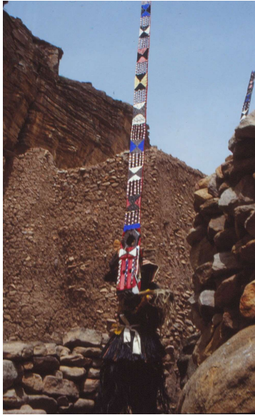
Boommasker tijdens de dans (W. van Beek)