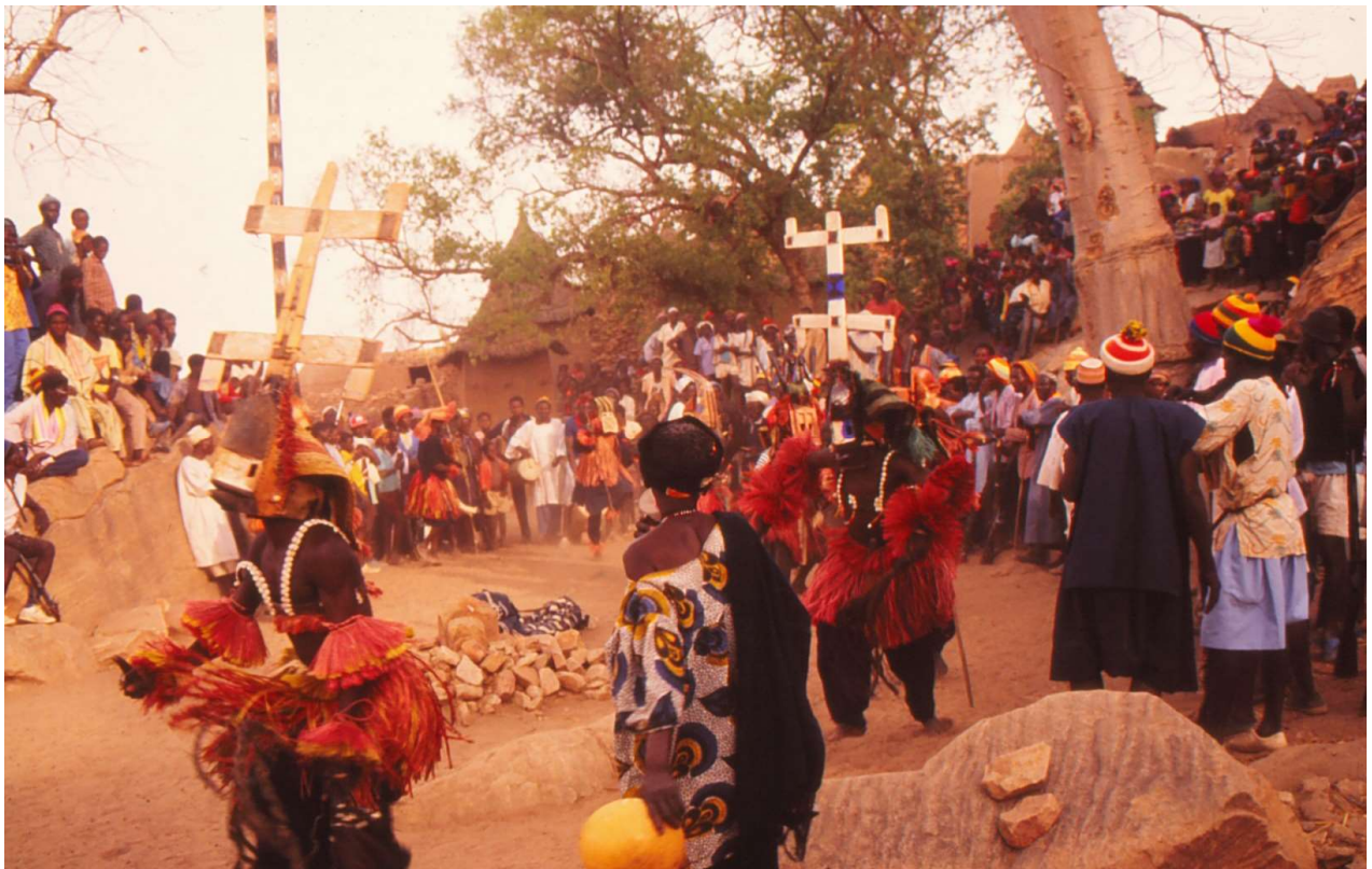
Een maskerdans Dogon Mali

Maskers verschillen in uiterlijke verschijning van dorp tot dorp. Door de jaren heen veranderen verschijningsvormen en betekenissen. Zo worden maskers en kostuums steeds vaker versierd met westerse attributen, zoals voorwerpen van aluminium of plastic.