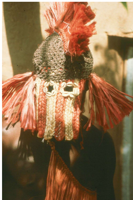
Ajagay masker