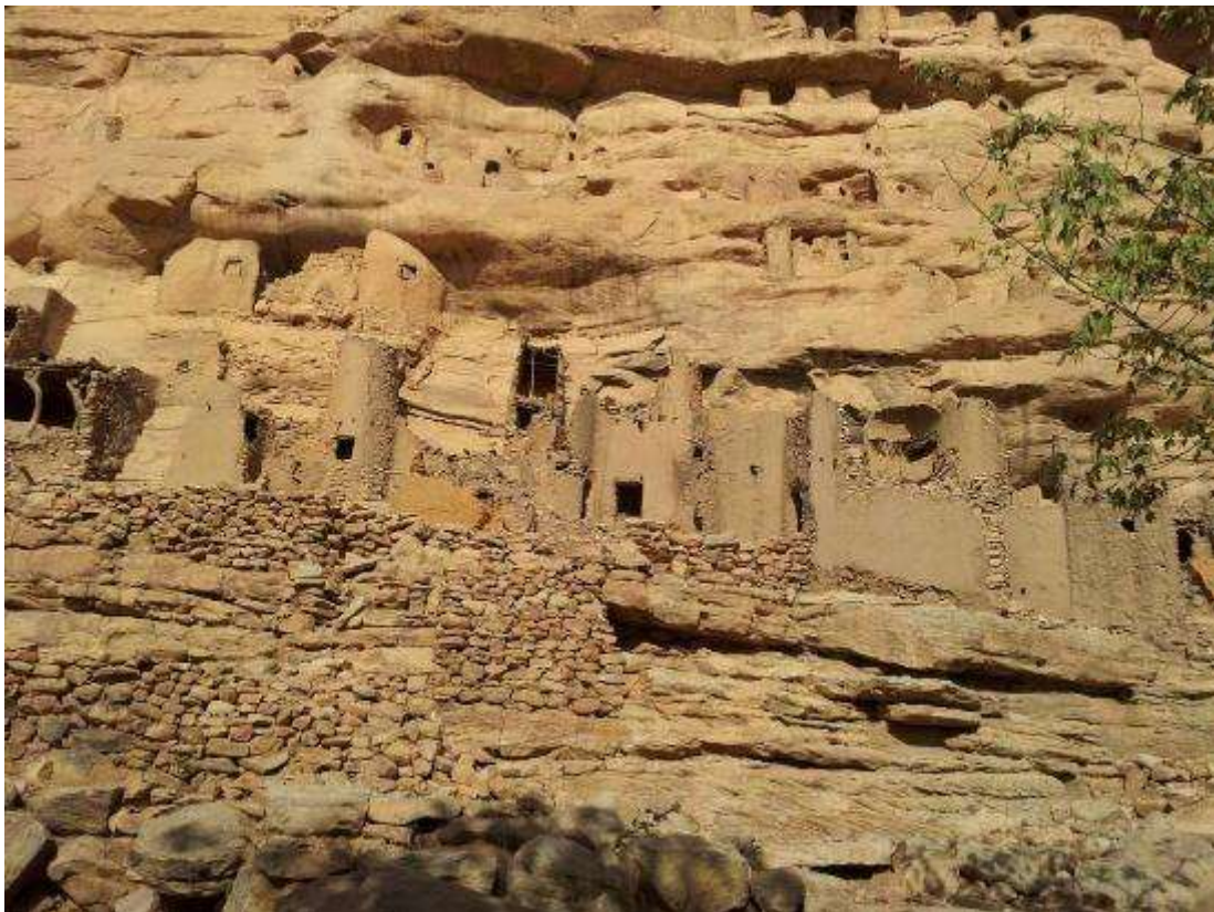
Klifwand met dorp Dogon , Mali

Mali is een van de Sahel landen aan de zuidrand van de Sahara (Sahel is het Arabische woord voor oever) en is al minstens 15.000 jaar bewoond. Toch weten we weinig van de vroegere bewoners. Ooit is het gebied vruchtbaar geweest, getuige de rotsschilderingen in de Sahara die olifanten, gazellen, giraffen en andere dieren tonen. Door de voortschrijdende uitdroging van de Sahara vanaf het vijfde millennium voor Christus, heeft de verwoestijning ook grote gedeelten van het huidige Mali onvruchtbaar gemaakt. De naam van het land is ontleend aan het legendarische rijk Mali dat rond het jaar duizend van onze jaartelling een groot gebied van de Sahel omvatte. Het rijk Mali was sterk geïslamiseerd, zoals blijkt uit reisverslagen van Arabische bezoekers.