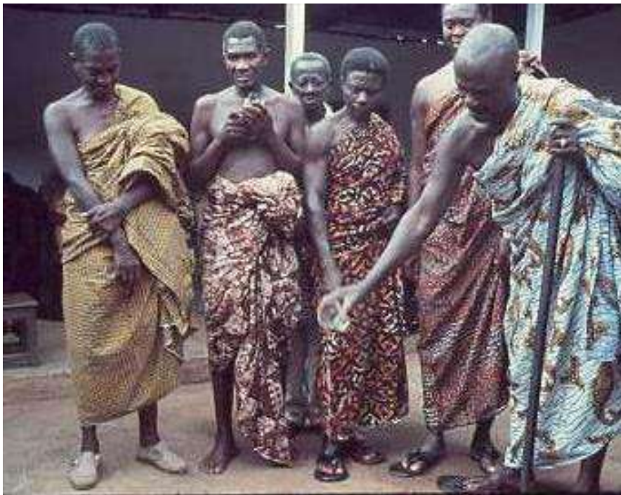
Een raadsheer van de Chief plengt voor de voorouders in Ashanti Ghana 1967

opgeroepen worden om aanwezig te komen in door mensen gemaakte voorwerpen zoals krachtbeelden (in Congo de bekende Nkisi beelden, soms spijkerbeelden genoemd. (Willett, 2002, 187, 227). De mens is zich bewust dat zijn lot in de handen van deze bovennatuurlijke (antropomorf voorgestelde) krachten ligt. Zij kunnen hem of zijn dierbaren ziek of armlastig maken, zijn vee doden, maar hem ook voorspoed en rijkdom, maatschappelijk aanzien of politieke macht geven. Voor de mens is het daarom een dagelijkse zorg de kwade krachten te neutraliseren of tot andere gedachten te brengen en de goede krachten aan zijn kant te krijgen en te houden.