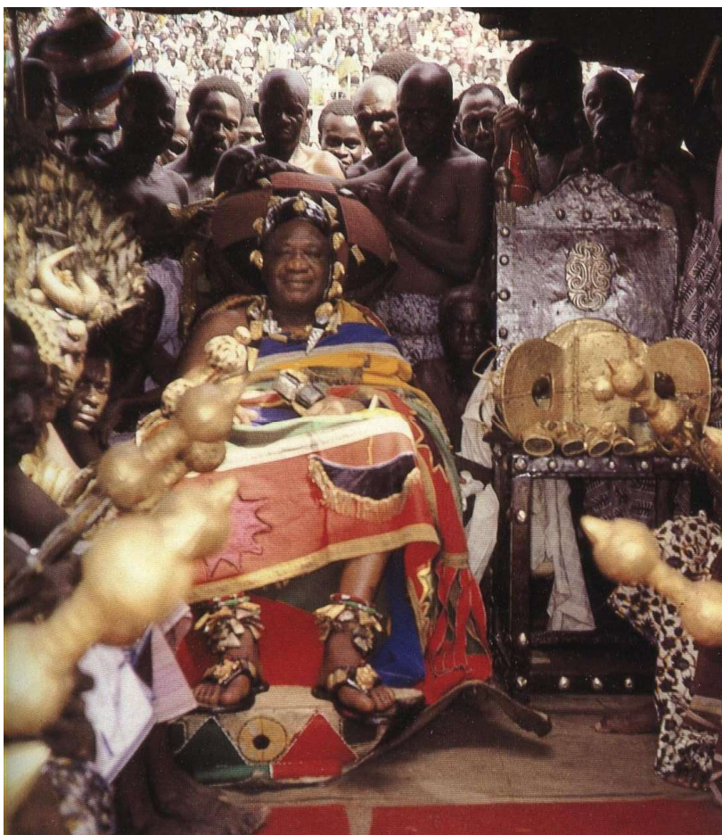
Koning Ashantehene met naast zich Gouden zetel Kumasi Ghana

De koningen van Benin hebben al vanaf de 14 de eeuw de beste bronsgieters en ivoorsnijders uit het land aan zich weten te binden. Hun kunstwerken getuigen van de macht en rijkdom van de Oba (Koning) van Benin. (Willett, 2002, 76,96-101,165-166).