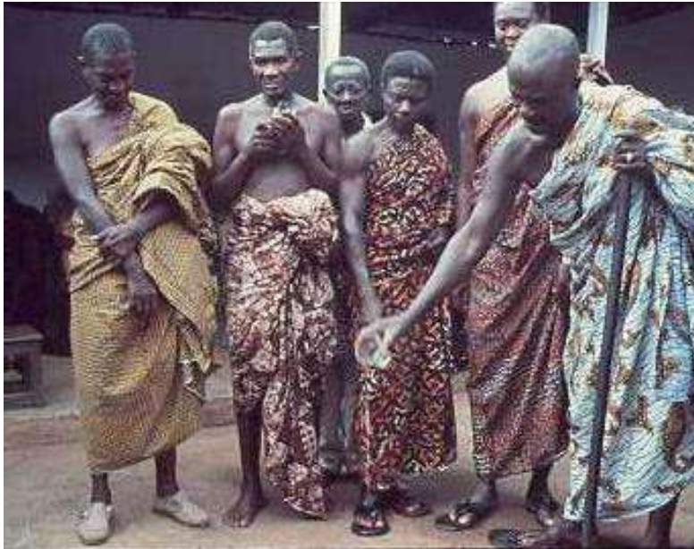
Een raadsheer van de Chieft pleegt voor de voorouders in Ashanti Ghana 1967

opgeroepen worden om aanwezig te komen in door mensen gemaakte voorwerpen zoals krachtbeelden (in Congo de bekende Nkisi beelden, soms spijkerbeelden genoemd. (Willett, 2002, 187, 227). De mens is zich bewust dat zijn lot in de handen van deze bovennatuurlijke (antropomorf voorgestelde) krachten ligt. Zij kunnen hem of zijn dierbaren ziek of armlastig maken, zijn vee doden, maar hem ook voorspoed en rijkdom, maatschappelijk aanzien of politieke macht geven. Voor de mens is het daarom een dagelijkse zorg de kwade krachten te neutraliseren of tot andere gedachten te brengen en de goede krachten aan zijn kant te krijgen en te houden.