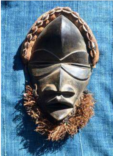
De angle masker Dan

Maskers worden verdeeld in vrouwelijke ( gle mu ) en mannelijke ( gle gon ). De vrouwelijke maskers hebben zachte rondingen, een ovale gezicht, zonder baard. De mannelijke zijn hoekiger, en hebben cilindervormige ogen. Binnen de mannelijke maskers bestaan uiteenlopende typen: diepliggende ogen, driehoekige ogen onder een uitstulpend voorhoofd; vooruitstekende neuzen; voorhoofden bekleed met hoorns van duiker antilopen; er zijn ook maskers met snorren, baarden en belletjes.