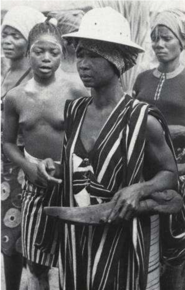
Deze vrouw heeft één prijs gekregen voor de wijze waarop zij haar huishouden organiseert

De Dan hebben een traditie om aan de meest gastvrije vrouw van een wijk of van het dorp een eretitel te verlenen. Deze gaat gepaard met de schenking van een ceremoniële rijstlepel. In de meeste gevallen is de steel versierd met een fraai gesneden hoofd. Deze lepels worden wake mia genoemd, grote lepels ( mia betekent lepel); de lepels met de hoofden: mewuoshlümia , houten lepels met een mensens gezicht. De eigenares van de lepel wordt genoemd: wake de , de vrouw die optreedt tijdens feesten. Zij mag dat doen, nadat zij de titel van meest gastvrije vrouw heeft verworven. Deze vrouw heeft aangetoond, dat zij haar huishouden voortreffelijk organiseert, gastvrij is, onderdak verleent aan reizigers en muzikanten, integer is en in hoog aanzien staat bij de andere vrouwen van de wijk of het dorp. Haar kwaliteiten blijken onder meer uit de fraaie wijze waarop zij de buitenmuren van haar huis beschildert, haar potten vormt of de gezichten van de meisjes beschildert, als zij uit het initiatiekamp komen en aan het dorp getoond worden als de jonge volwassenen. Voor iedereen die het Dan gebied bezoekt, is het duidelijk dat de man de leiding heeft in het dorp en in de