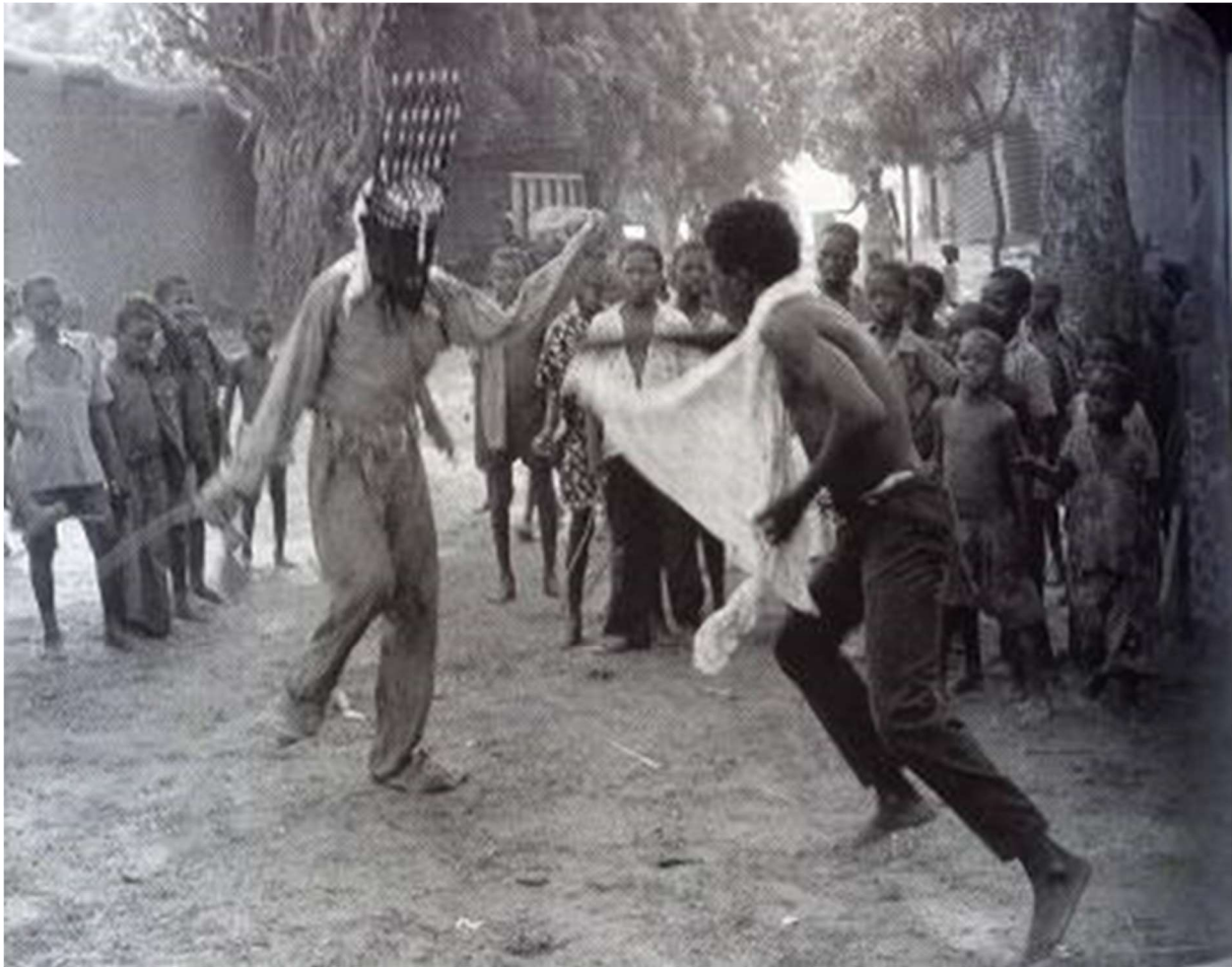
Dans van het Ntomo genootschap maskerdans 1980

Bij het Ntomo initiatie genootschap zijn nog niet besneden jongens aangesloten. Het genootschap bestaat niet overal in Bamana land en waar het bestaat heeft het verschillende namen. De initiatie van jongens ( de rituele overgang van kind naar man) vindt eenmaal in de drie jaar plaats. In de weken dat de jongens in het initiatiekamp verblijven, leren zij de deugden van een volwassen man: het beheersen van de tong (niet altijd zeggen wat je weet en denkt; de kunst van het zwijgen) en de kunst van het spreken. Het meest bekende lied van het genootschap zegt: "houd je mond stijfdicht; je mond is de vijand!" Zij dansen met een zweepje in de hand. Het zweepje is het instrument waarmee hen in deze periode het zwijgen wordt geleerd: ze worden er mee geslagen als een overtreding wordt geconstateerd