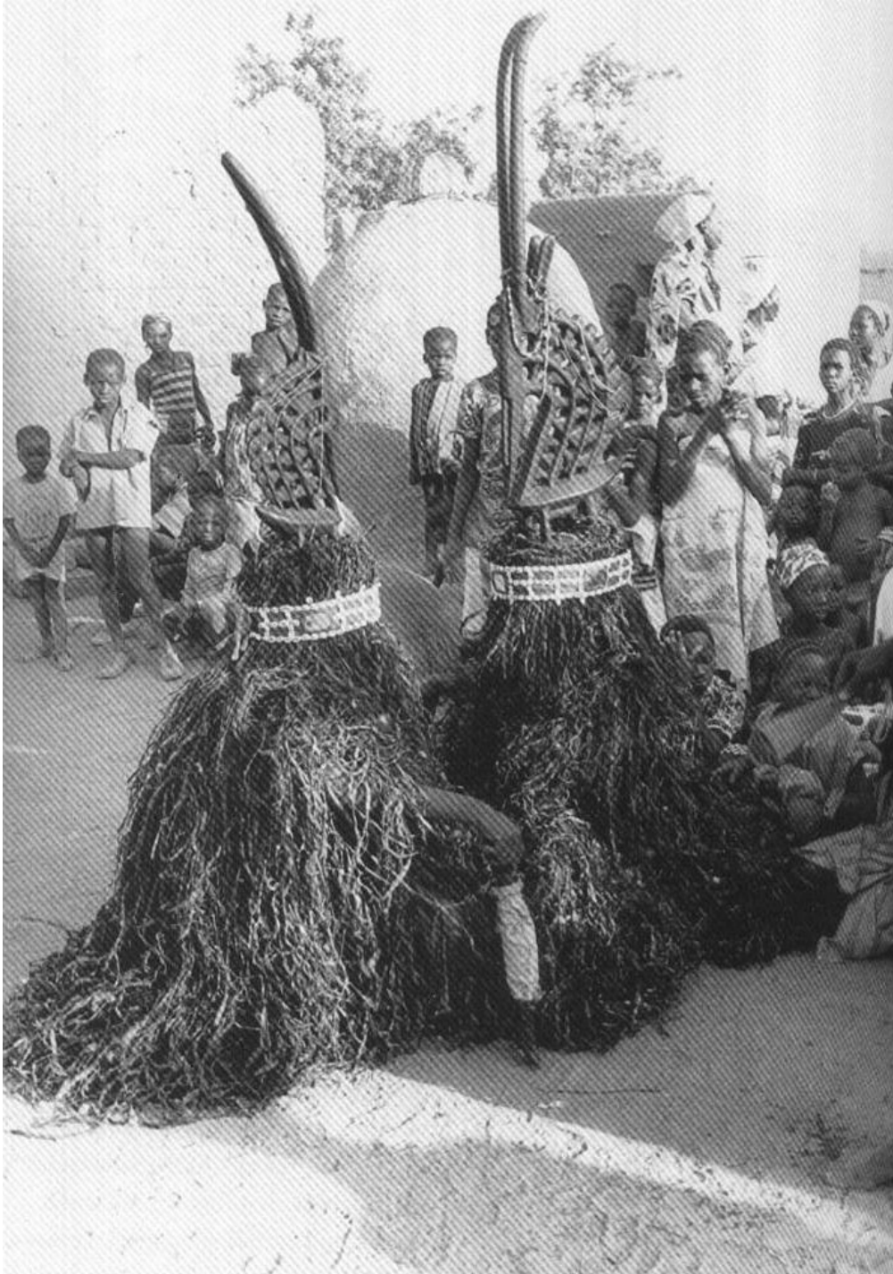
Thimara antilop masker dans

Een ander machtsgenootschap is Tshiwara (ook gespeld als ci-wara ). Het genootschap richt zich op de belangen van de landbouwers. De mannelijke antilop beeldt de paard antilop uit, de vrouwelijke de onyx antilop. Er bestaan ook Tshiwara maskers die een compositie vormen van verschillende dieren, waaronder de miereneter, de pangolin en de python. Volgens een Bamana legende is het verbouwen van gewassen in de mensenwereld geïntroduceerd door deze drie dieren. De miereneter had gezien hoe God de aarde schiep en wist daardoor hoe hij © 2018 Harrie Leyten