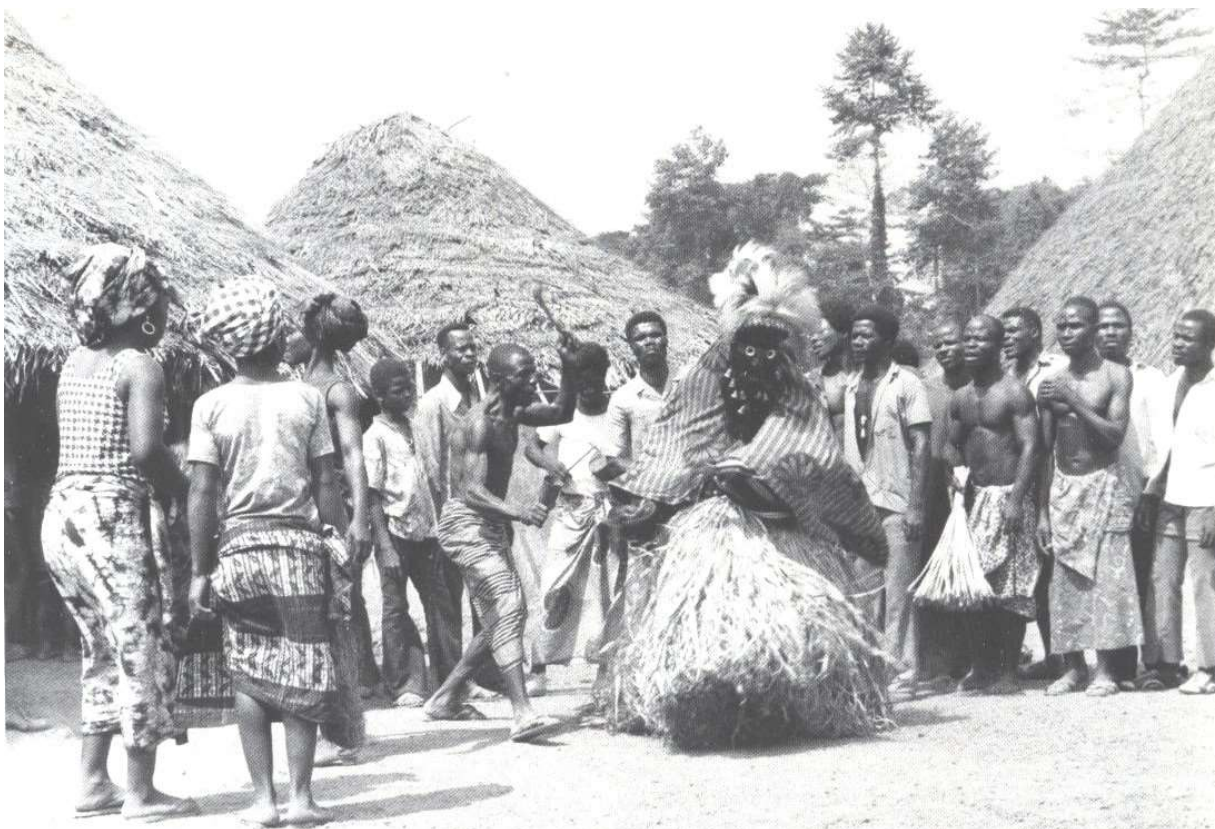
Dans van genootschap

Iemand wordt lid van een genootschap door middel van een initiatie, een proces van het aanleren van de mores van het genootschap, een of meer toetsen doorstaan, het plechtig beloven van een erecode over onvoorwaardelijke trouw aan de leiders van het genootschap en de plicht van geheimhouding over alles wat zich afspeelt binnen het genootschap (vandaar de benaming van Geheim Genootschap) en ten slotte het betalen van een som geld. Eenmaal lid van het genootschap kan iemand opklimmen in de rangen en standen er van. Bij iedere promotie is er opnieuw een toets, een proces van initiatie en het betalen van geld. Dit laatste kan de vorm aannemen van het organiseren van een groots feest voor medeleden. Het hoogste ambt, dat van leider van het Genootschap, wordt doorgaans pas bereikt na tientallen jaren.