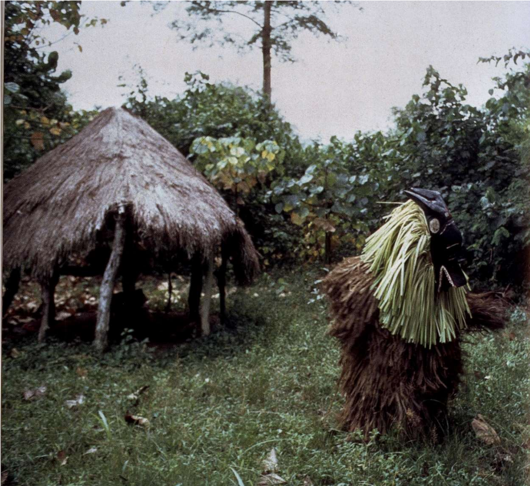
Gye in het heilige bos van Banggofla 1984.

iemand een masker in opdracht laat maken, kan hij elk wild dier kiezen, behalve het dier dat een speciale relatie met hem of zijn familie heeft, waardoor een taboe op de weergave ervan ontstaat. Eigenaren van een gye-masker eten het vlees van een hond of sorghum niet. Een gye masker is altijd eigendom van een familie. Maar wanneer meer leden van een gezin er een willen, moet toestemming worden gevraagd aan de andere eigenaars.