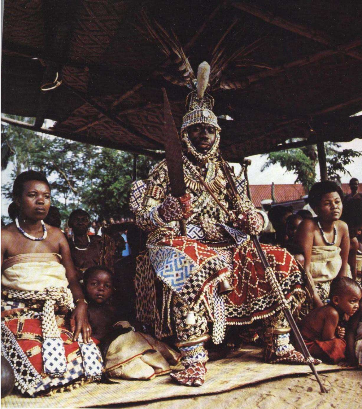
Koning Kuba in vol ornaat

Sinds koning Shyaam hebben achtereenvolgens (waarschijnlijk) 125 koningen geregeerd. Hoewel koning Shyaam aan de Atlantische kust is geweest en daar wellicht blanken heeft ontmoet, is geen blanke in het gebied van de Kuba geweest tot 1880, toen Silva Porto, een Portugese ivoorhandelaar vanuit Angola het gebied binnentrok. Zijn bevindingen leidden tot verhoogde interesse van Portugal in het gebied. Dit stuitte op verzet van Koning Leopold van België die het gebied wilde inlijven in zijn Kongo Vrijstaat. Engeland en Frankrijk bemoeiden zich met het conflict. Tijdens de Conferentie van Berlijn kreeg Leopold zijn zin, maar de Kuba zelf gaven zich niet gewonnen. Na vijf jaren van militaire expedities werd het verzet van de Kuba in 1904 bloedig onderdrukt. De hoofdstad van het Kuba rijk werd veroverd en geplunderd, de koning afgezet en gevangengenomen. België regeerde het gebied via indirect bestuur. Daartoe werd de Compagnie du Kasai opgericht. De Kuba koning werd een vazal van het Belgische bestuur. In ruil daarvoor werd hij door de bezetters in de watten