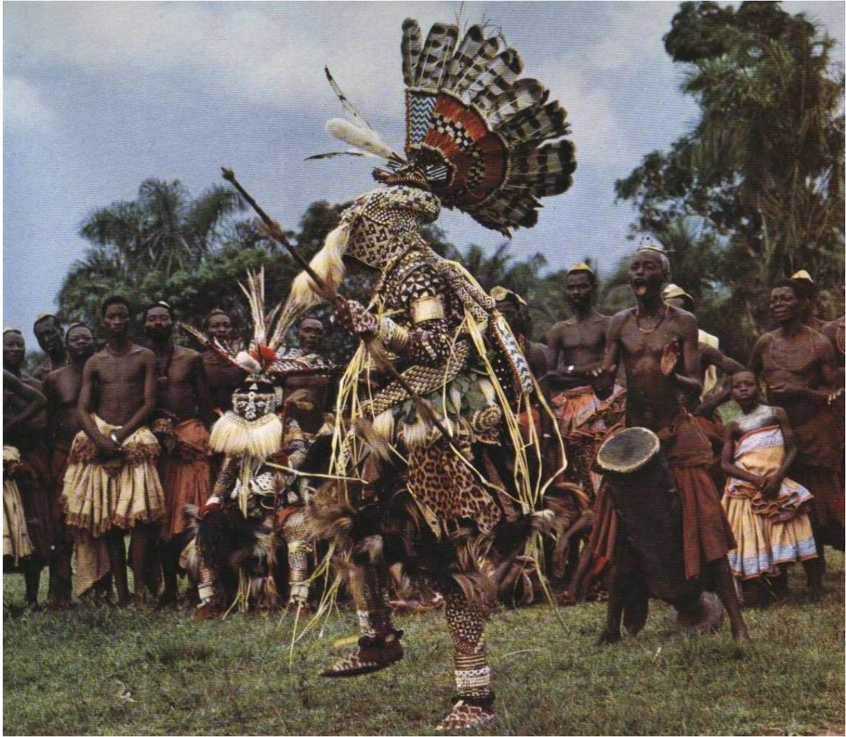
Bwommasker dans

Het Bwom masker wordt gekarakteriseerd door een geprononceerd, bolvormig voorhoofd. Volgens sommigen personifieert het een pygmee. Het is een houten masker, dat gedeeltelijk bedekt is met koper en versierd met kralen en kaurischelpen. Dit masker danst vaak samen met het Mwaash aMbooy masker tijdens de initiatie rituelen voor jongens. Bwom danst dan een schijngewacht met een ander masker (dat de koning voorstelt) over de gunst van de zuster van de koning. Deze vrouw wordt gedanst door het Ngady aMwaash masker. De dans speelt de mythische oorsprong van het volk, inclusief de incestueuze verhouding van het oerkoppel. (Blier 1998, 240)