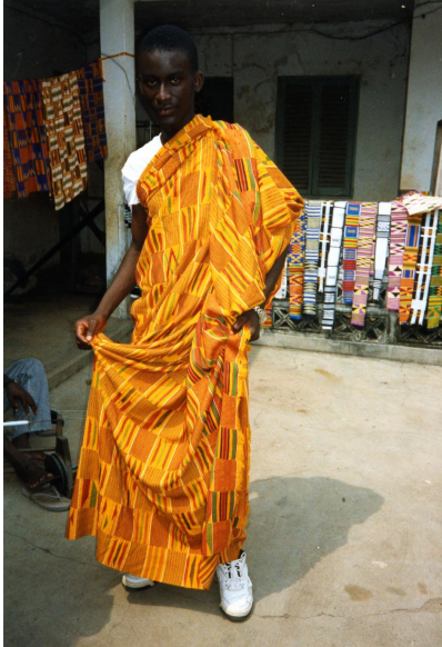
Man in Kente doek

patronen geschilderd worden met plantaardige verfstoffen of met een soort modder ( bogolanfini of modderdoeken, bekend van Mali en Noord Ivoorkust). In Zuid Ghana bestaan Adinkra doeken, die met symbolische motieven in inkt bedrukt, gedragen worden bij begrafenissen.