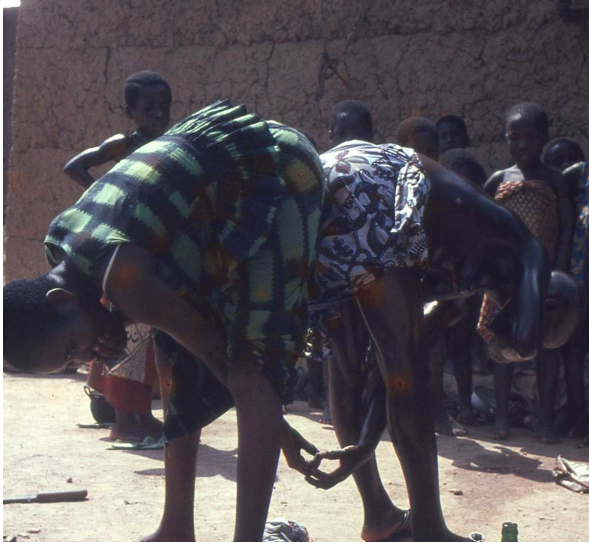
Meisje (rechts) krijgt hard gekookt ei van een vriendin: Sefwi, Ghana. Foto: H.Leyten 1967

mag aanraken, maar moet kauwen zonder te kruimelen ( zij zal dan later geen kinderen verliezen door vroegtijdig sterven).