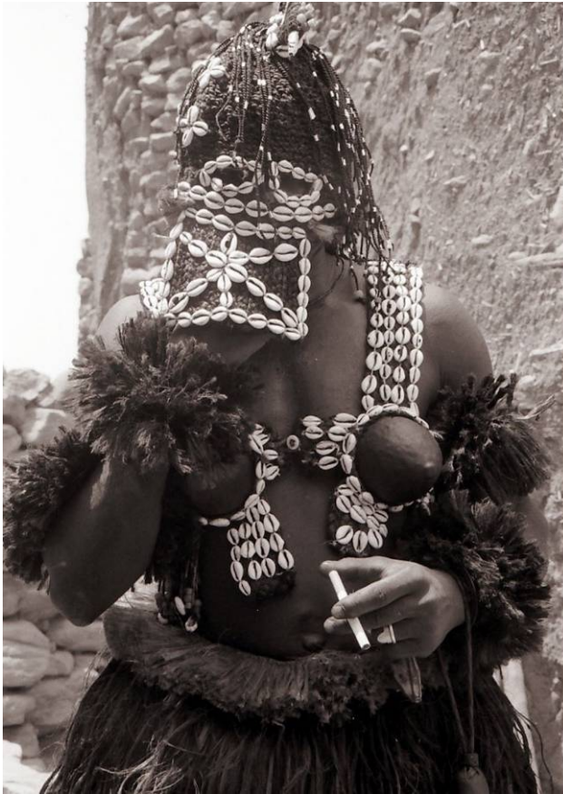
Een Dogon Steltmasker in een rookpauze in 1989 in Amani. (W. Van Beek)

soms fraai versierde instrumenten, waarbij vaak kunstig gesneden beelden en andere objecten een belangrijke rol speelden.