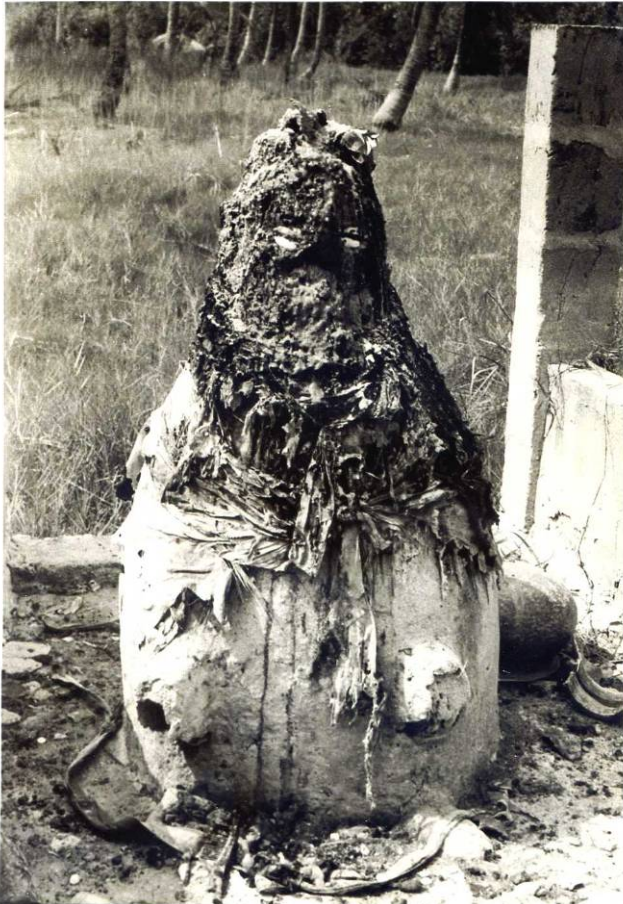
EWE Legba bij Dzelukofe 1964, Ghana

Het binnenland van West- en Centraal Afrika bleef grotendeels terra incognita voor de blanken aan de kust. Afrika kreeg de bijnaam 'het donkere continent' en vanwege zijn slechte klimaat 'het graf der blanken'. Maar de nieuwsgierigheid naar wat zich in de binnenlanden afspeelde bleef bestaan en werd steeds sterker. In de 19 de eeuw kwamen de 'ontdekkingsreizen' goed op gang. Zij werden ervaren als veroveringstochten, soms zelfs met een seksuele connotatie: men sprak van het 'penetreren' van Afrika. Maar om het brave thuisfront niet al te zeer te shockeren, werden de expedities ook gezien als pogingen 'om de grenzen van de onwetendheid terug te dringen', om 'slaven te bevrijden' en 'heidene