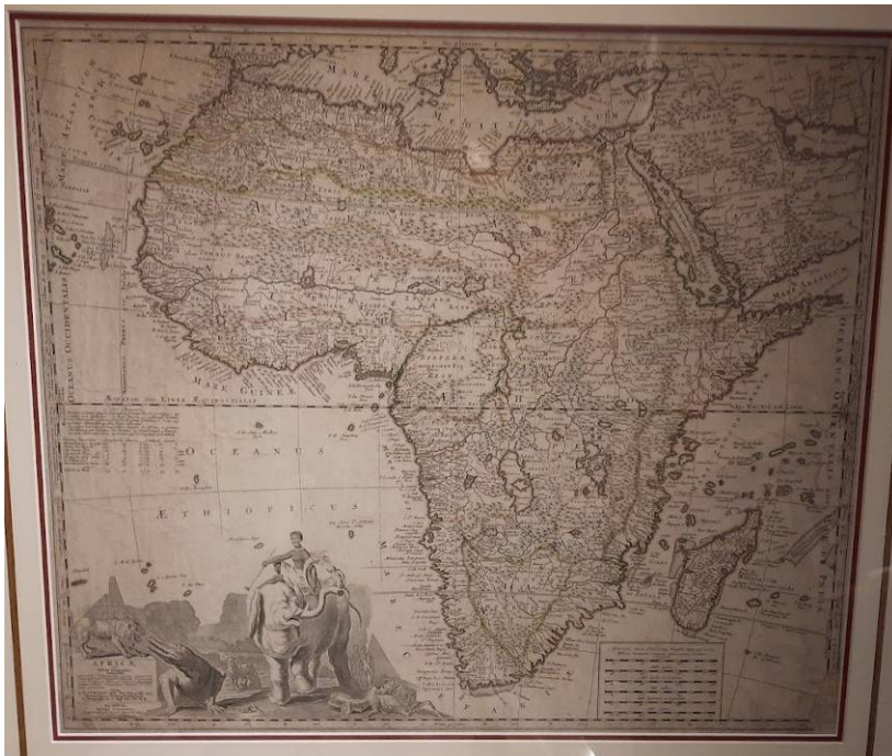
Historische kaart Afrika 17 e eeuws

In geheel Zuidelijk Afrika worden rotstekeningen gevonden. Het onderzoek naar ouderdom en betekenis staat nog in de kinderschoenen. Het lijkt dat wetenschappelijk onderzoek in sommige gebieden hier (in tegenstelling tot die in de reeds eeuwenlang lege Sahara) vergemakkelijkt wordt door nog levende tradities die een verband suggereren met de afbeeldingen op de rotsen. (Willett, 2002, 54-60)