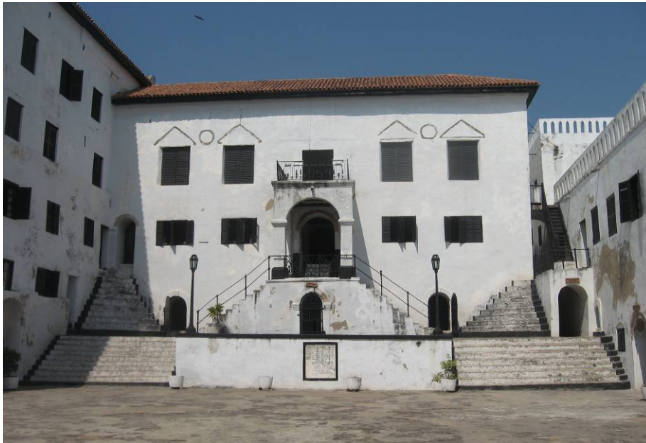
Fort Elmina Ghana

nieuwe bron van informatie op gang. De verhalen van de zeevaarders, de avonturen die zij meemaakten, de rapporten van de kapiteins aan hun opdrachtgevers in Lissabon, maakten diepe indruk op Europa en prikkelden de handelsinstincten van andere zeevarende naties als de Hollanders, Engelsen, Denen en anderen. In 1637 veroverde een Hollandse vloot het Portugese kasteel Elmina .