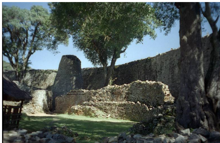
Ruïne van Zimbabwe

In Zuidelijk Afrika is wetenschappelijk onderzoek lang geblokkeerd geweest onder politieke druk.