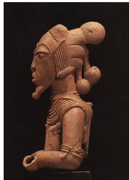
Nok kop, keramiek